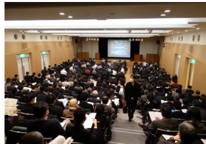
講演会・聴講風景