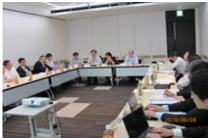
調査研究部会・会議風景

また、機械安全普及に係る講演会として「機械安全規格の紹介」－機械安全規格でリスクを低減しよう！－を実施した。