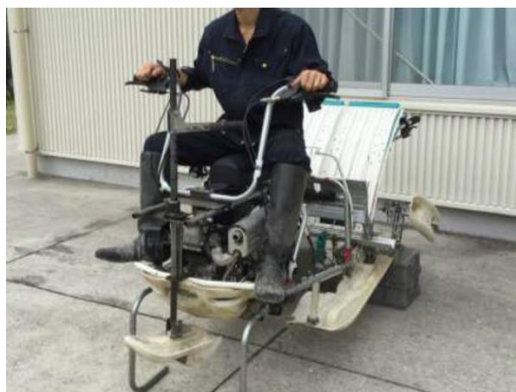
図1 乗用一輪田植機

走行・植付性能評価試験は、福島県二本松市太田布沢の棚田（図2）において2019年、2020年に実施し、ほ場作業効率やスリップ率などの走行性能、植付深さ、欠株、株間、株数などの植付性能、作業者の心拍数などの作業負荷について、測定・評価を行った（図3）。その結果、歩行田植機と同等の走行性能と乗用化による労力低減が確認された。