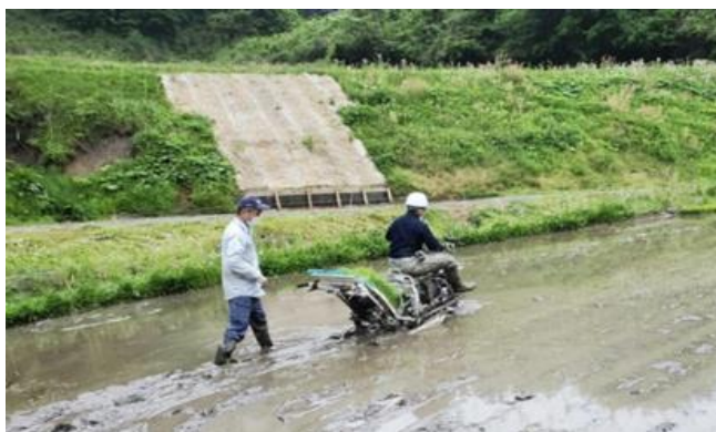
図3 走行・植付性能評価試験

歩行用田植機の自動走行については、RTK-GNSSにより位置情報を測位し、マイコンでモータを制御することで、直進および旋回走行プログラムを構築した。また、水稲育苗箱における精密条播の性能評価では、播種機HS329Bで26条の条播が行え