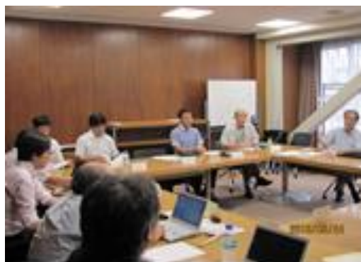
開発部会・会議風景