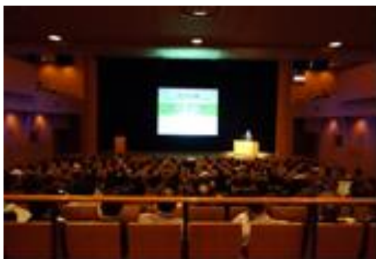
講演会・聴講風景(28年度)

また、機械安全国際規格の紹介－制御システムの安全関連部（ISO 13849-1）、機械の電気装置の安全（IEC 60204-1）－を実施した。