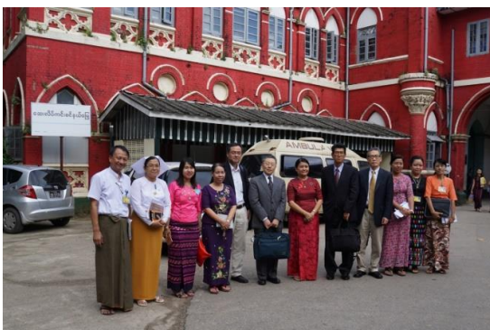
ヤンゴン中央女性病院訪問