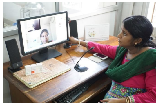
受信した眼の写真についてビデオコンサルテーションを用いて村の担当者と話し合う州都眼科病院側の様子