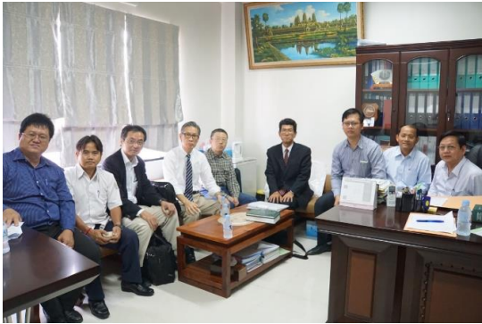
カンボジア保健省訪問