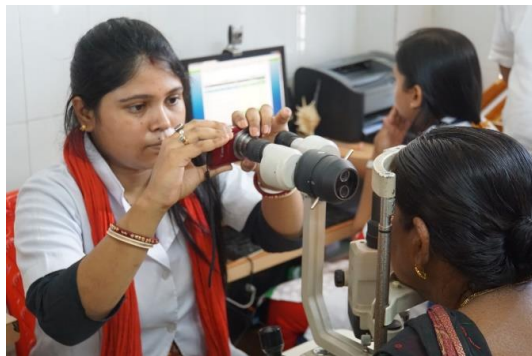
村の眼科技師が検査機を通して患者の眼の写真を撮影し州都眼科病院へ送信