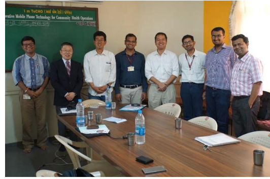
SEWA Rural (医療 NGO) 訪問