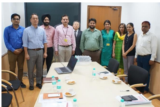
インド保健家族福祉省訪問