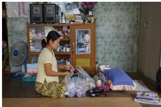
ミャンマーの村の助産師訪問