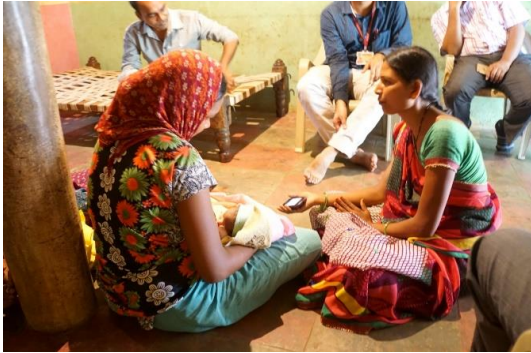
ヘルスワーカーがモバイルヘルスアプリケーションを持って産婦・乳児宅訪問