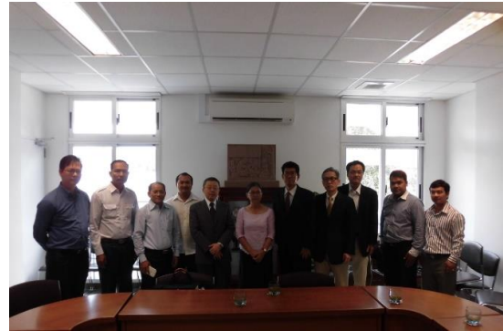
カンボジアの母子保健病院訪問