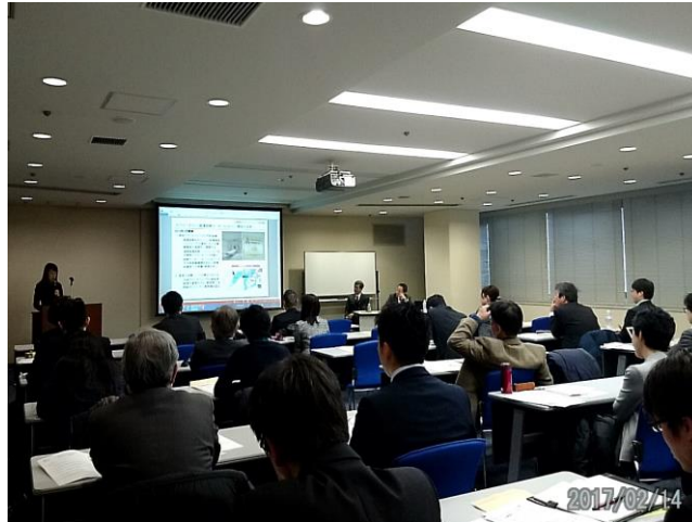
ロシアビジネスセミナー in 京都 －医療関連ビジネスを中心に－