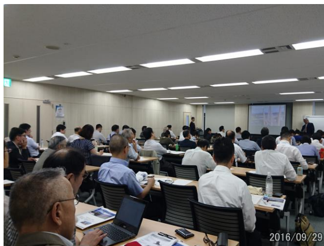
ロシアビジネスセミナー —インフラ・ビジネスの現場から—

ロシアおよびロシアビジネスに対するイメージの悪さあるいは無関心の状況を改善するために、東京（「ロシアビジネスセミナー—インフラ・ビジネスの現場から」—9月29日）、京都（「ロシアビジネスセミナー in 京都—医療関連ビジネスを中心に」—2月14日）、旭川（「ロシアビジネスセミナー in 旭川—医療分野を中心に」—3月17日）で、合計3回、ロシアビジネスセミナーを開催した。