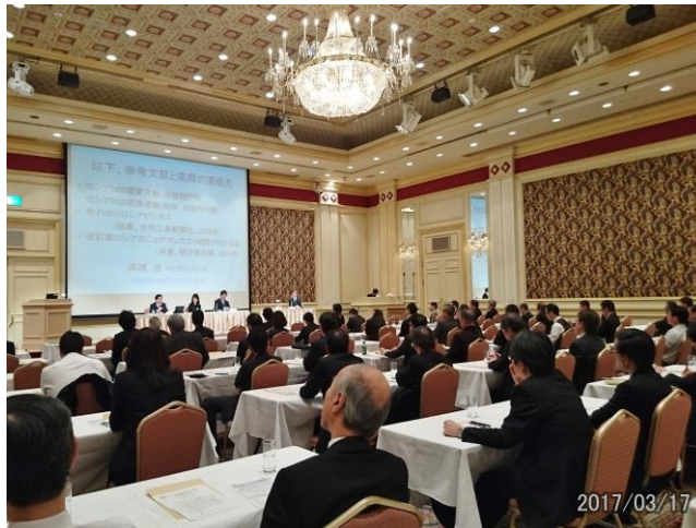
ロシアビジネスセミナー in 旭川 －医療分野を中心に－