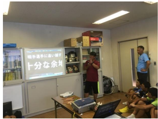
平成28年08月26日～28日 近畿ブロック合宿（京都・向日町競輪場）