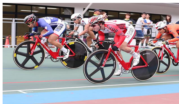
全日本学生選手権トラック大会