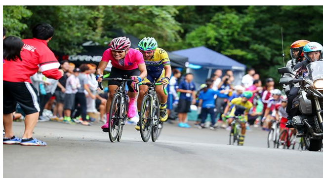
全日本大学対抗選手権 (ロード)