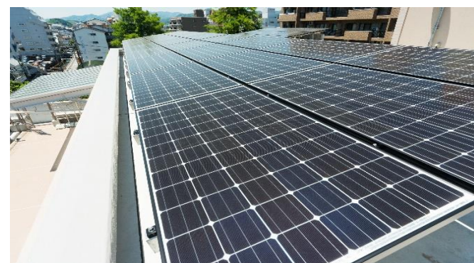
屋上 太陽光パネル