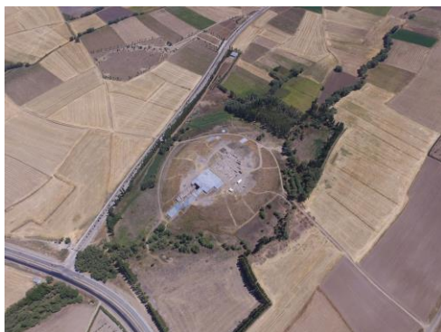
カマン・カレホユック遺跡

当該事業は、常に「発掘調査」と「文化財保存」を併行した形で進めているのが特徴で、平成28年度も多くの学生、若手研究者の養成において大きな役割を果たすことができたと考えています。