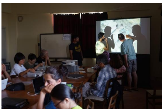
毎日のミーティングでの発表