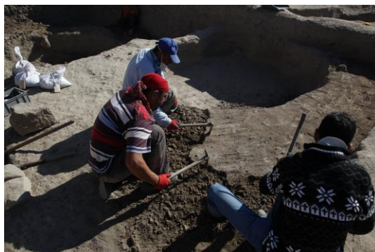
発掘現場での作業