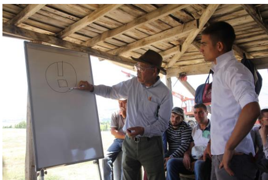
毎週現場で行なわれる授業