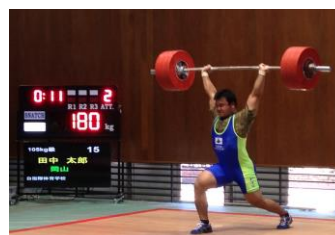
国民体育大会ブロック大会 競技の様子