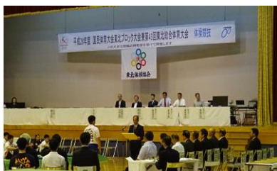
国民体育大会ブロック大会 競技会場の表示

全国9ブロックで実施した国民体育大会ブロック大会に対し、開催費の一部を助成した(参加者42,570名)。