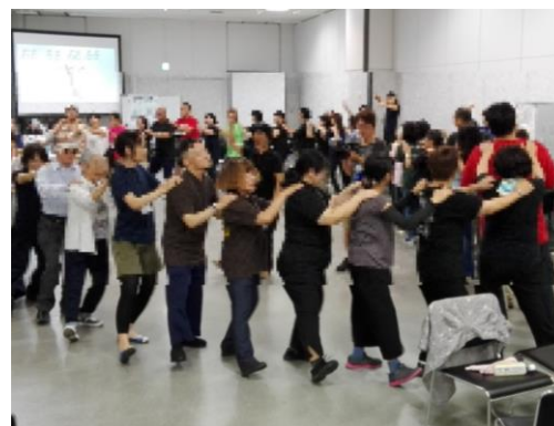
分科会「楽しくダンスを踊りましょう」