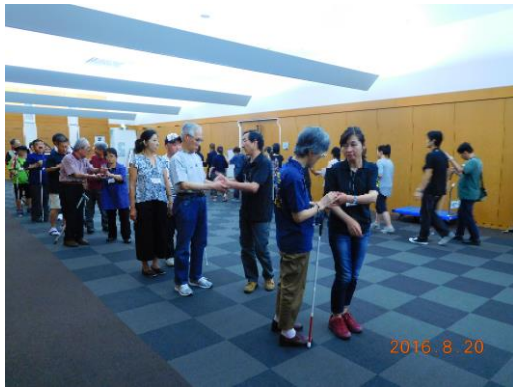
分科会「安全で安心な歩行のために」