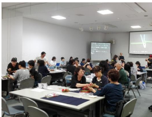
分科会「クリスマスリース作り」