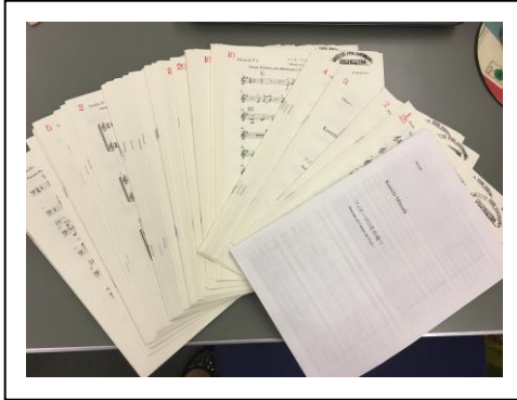
名古屋公演プログラム