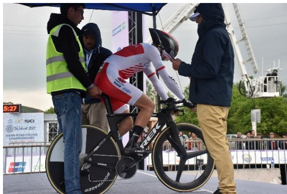
男子エリート個人タイムトライアル