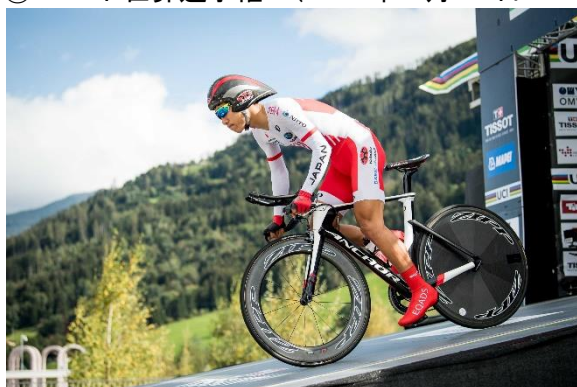
男子エリート・個人TT