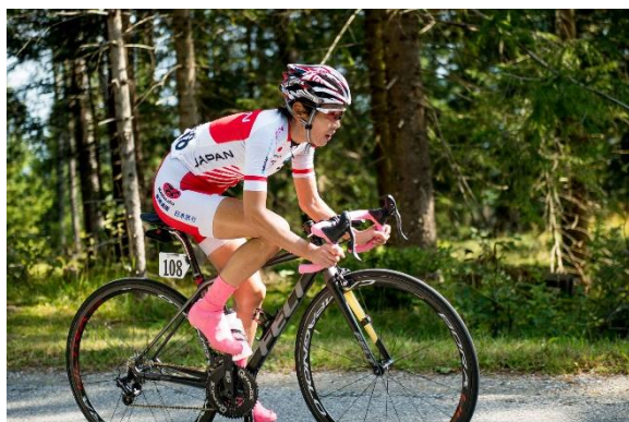
女子U23・ロードレース