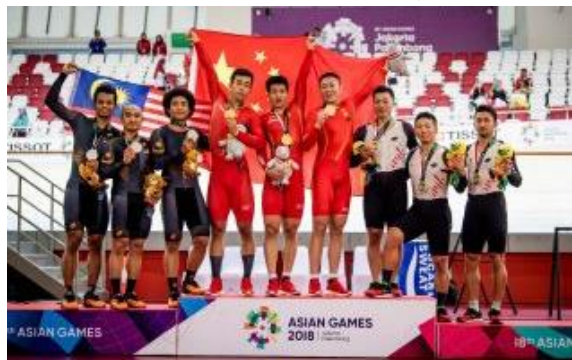
男子チームスプリント