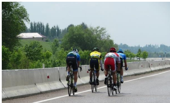
男子ジュニアロードレース