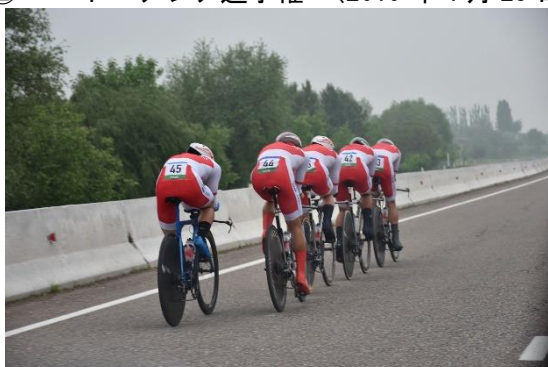
男子エリート・チームタイムトライアル

② ロード アジア選手権 (2019年4月23日~28日・ウズベキスタン・タシュケント)