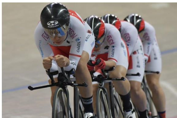
女子チームパーシュート