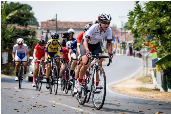
女子エリートロードレース