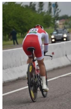
女子U23・エリート個人タイムトライアル