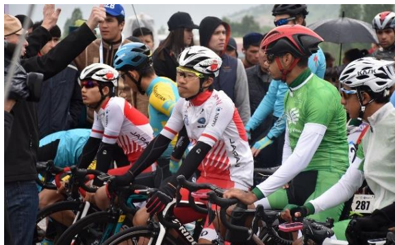
男子U23ロードレース