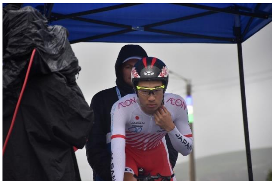
男子U23個人タイムトライアル