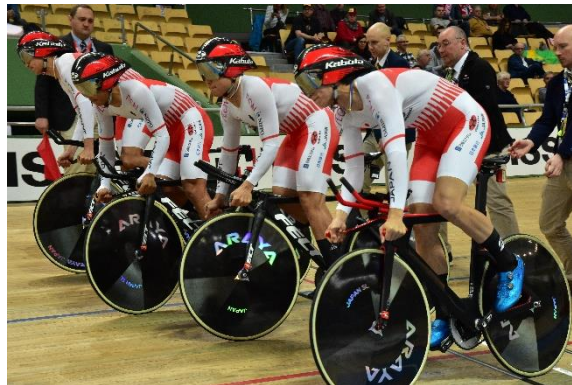
男子チームパーシュート