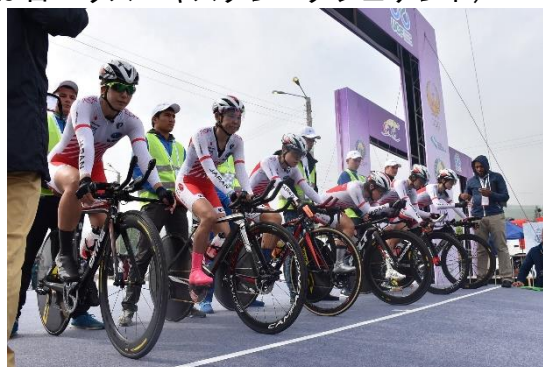
女子エリート・チームタイムトライアル