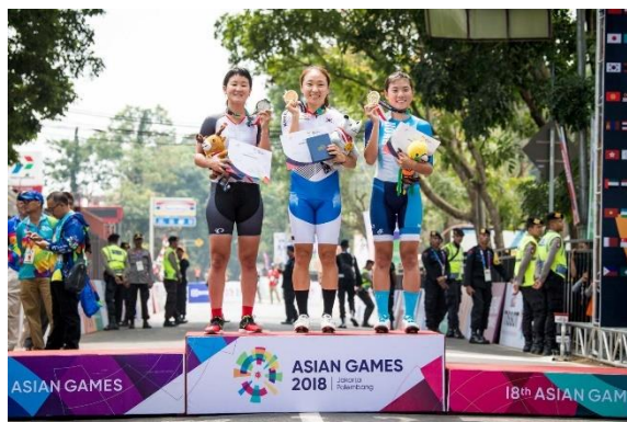
女子エリート個人タイムトライアル