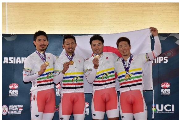
男子チームスプリント