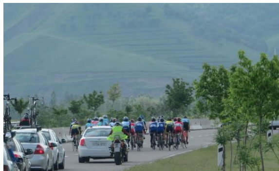
女子ジュニア・ロードレース