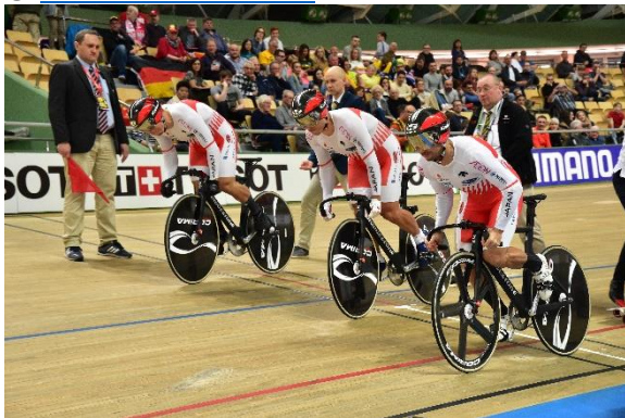
男子チームスプリント