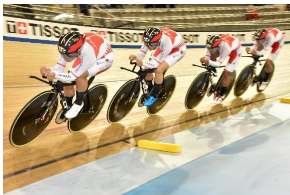
男子チームパシュート