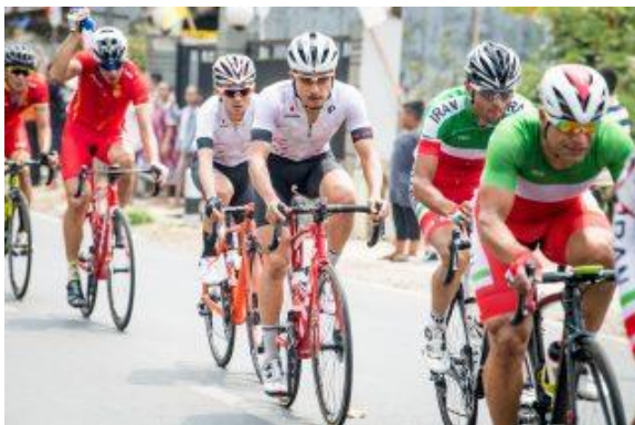
男子エリートロードレース