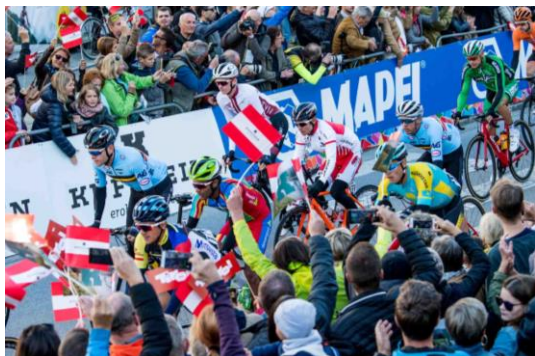
男子エリート・ロードレース