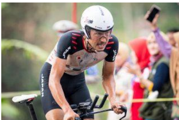
男子エリート個人タイムトライアル