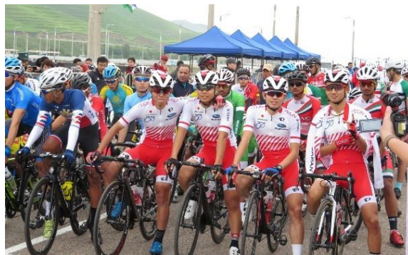
男子ジュニアロードレース