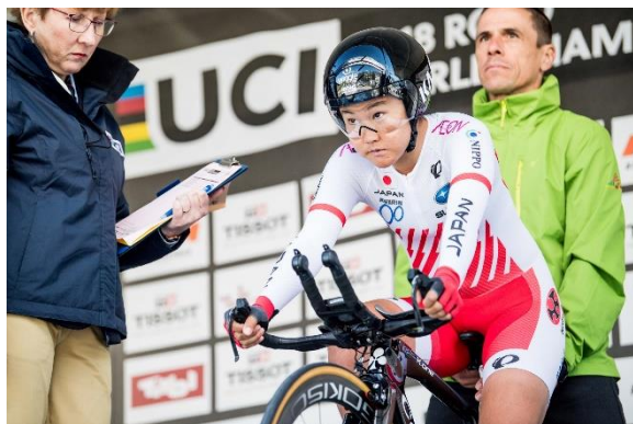
女子エリート・個人TT