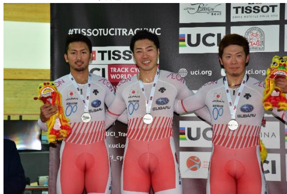
男子チームスプリント