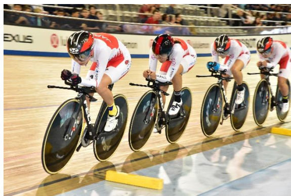
女子チームパシュート