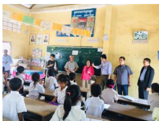
寄贈先の子も達と交流 カンボジア