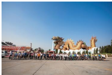
国際交流プログラム タイ

大阪府内の7ヶ所から回収した引き取り手のない放置自転車を修理・再生し、自転車を必要としているタイへ10月に350台の自転車を、またカンボジアに373台、合計723台の自転車を贈った。また、この補助事業を様々な団体やイベントと連携して広報し、また国際交流プログラムを通じて今後地域社会や国際社会で活躍、貢献できる人材育成への取り組みを行った。