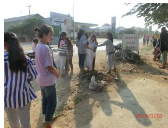
環境改善のためにゴミ拾いをする生徒達