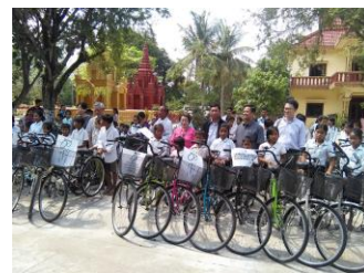
自転車贈呈式典 カンボジア