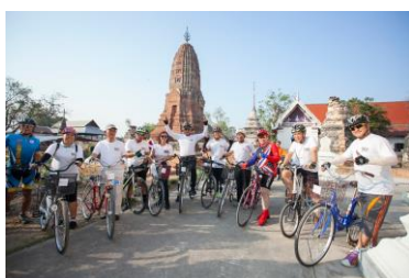
事業を支えるボランティアメンバー

贈られた自転車を地域の共有財産とし有効に活用することで、それまで不可能だった通学や仕事の効率化、生活の改善を可能にし、受益者達が自立への第一歩を踏み出し、将来をより良いものにかえていくことができるようになった。そのことが地域社会福祉環境の底上げとなり、ネットワークを活かして地域住民が互いに協力しながら地域社会を創造していくことにつながっている。事業を通じて地域共同体の結束が強まり、地域の他の問題解決に対する協力体制もより強固になってきている。さらに地球環境保全への意識を高めることで、国境を越えて同じ地球市民としての視点を持ち、互いに協力しあう国際交流の推進活動を拡げていくことが期待される。自転車を通じて、日本と各国の国際交流が活発になり、人と人の絆が深まることによって、草の根の理解と協力の輪が広がることが期待される。